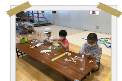
ペットボトルロケット作り！ みんな全集中で作成☆