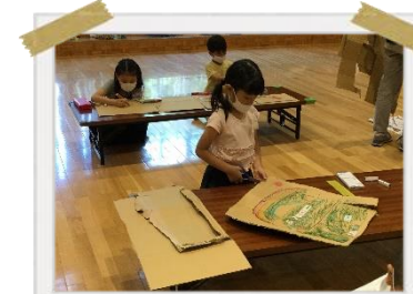
段ボールに絵をかって オリジナルパズルを作成♪