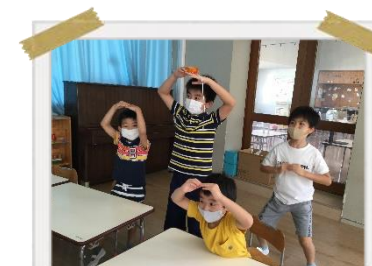
みんなで力を合わせて プログラミングに挑戦☆