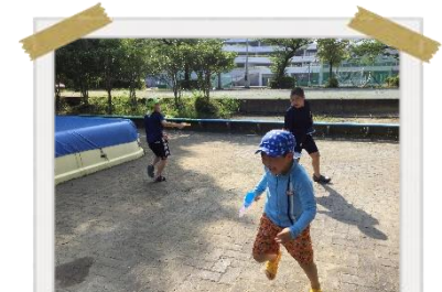
暑さも吹き飛ばす！ みんなで楽しく水遊びをしました★