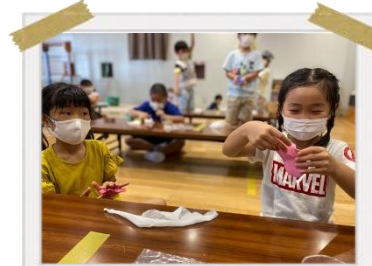
好きな色のスライムを作りました！ 不思議な手触りにみんな大興奮！