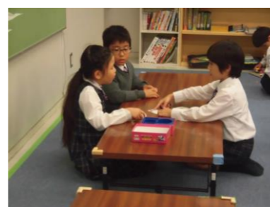
スピード勝負! カードを多く取れるのは 誰かな?