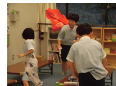
プログラムの後は異学年で 仲良く自由遊び♪