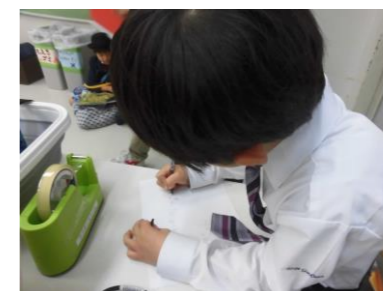
スペシャルプログラムで学んだ ことを忘れないようにメモ