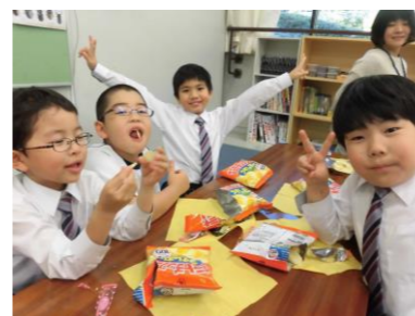
おやつのパテチップスに みんな大興奮☆