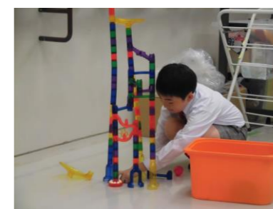
ビー玉転がし作成中! とても集中しています。