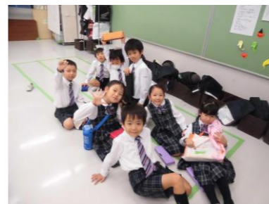
1年生英語のみんなは 毎週早く並んで 準備万端!