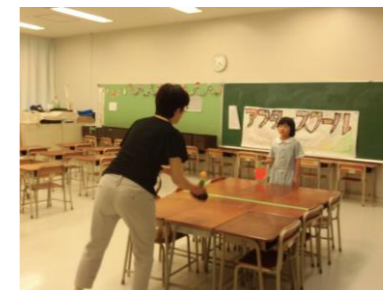
アフターのスタッフと 真剣に卓球勝負!!