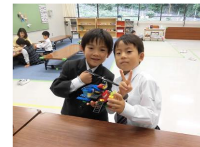
お友だちと協力して 大きな作品が完成☆