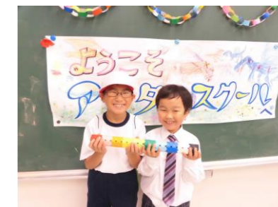
LaQで綺麗な万華鏡の完成☆