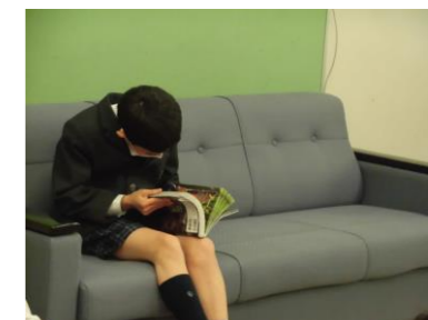
【2/6のソファー】 人数が少ない日は 広々とソファーが貸し切りに！