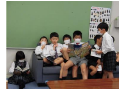
【12/2のソファー】 異学年で譲り合って ソファーを使っています☆