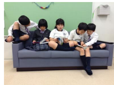
【1/17のソファー】 同じ本が読みたいときに仲良く 見ている姿が微笑ましいです(^-^)