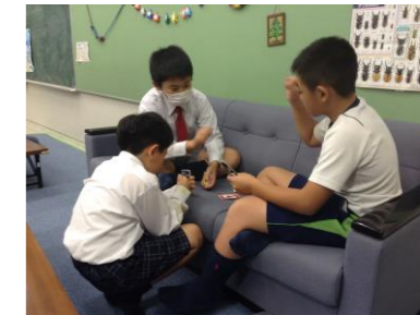
【12/16のソファー】 高学年のみんなで UNO対決！！