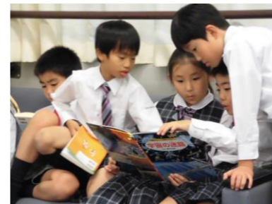
【11/27のソファー】 3年生はソファーが大好き♪ 皆で集まって座ってます！