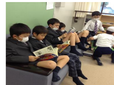
【1/30のソファー】 宿題が終わったら読書タイム📖 素敵な本に出会えたかな？