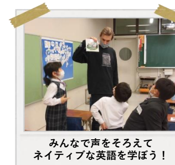
みんなで声をそろえて ネイティブな英語を学ぼう！