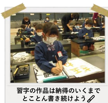
習字の作品は納得のいくまで とことん書き続けよう✍️