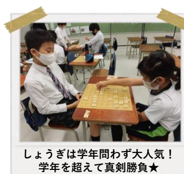
しょうぎは学年問わず大人気！ 学年を超えて真剣勝負★

※定期プログラムの様子はアフタースクールブログでも紹介されています！ ぜひ表面のURLまたはQRコードからご覧ください。