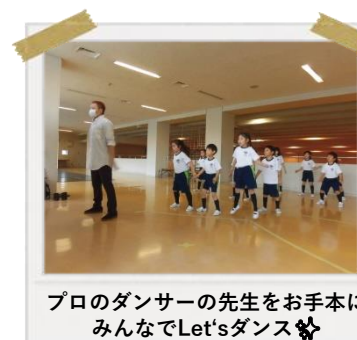
プロのダンサーの先生をお手本に みんなでLet'sダンス💃