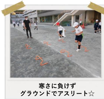
寒さに負けず グラウンドでアスリート☆