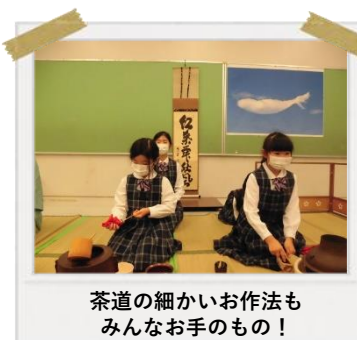
茶道の細かいお作法も みんなお手のもの！