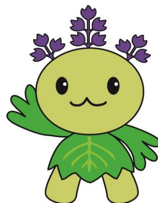
桐蔭学園公式 マスコットキャラクター 「キリリン」