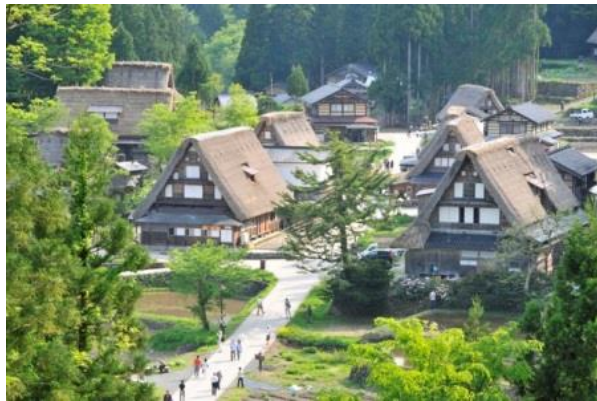
(南砺市観光情報サイト「旅々南と」より)

問3 下の写真は、五箇山 ごかやま の合掌造り がっしょうづく の集落 しゅうらく を写したものです。写真を見て以下の間に答えなさい。