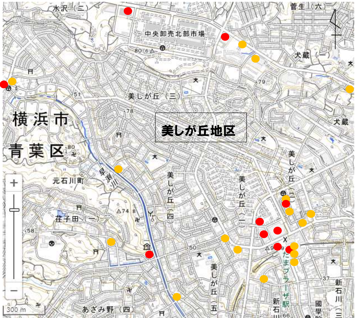
図3 美しが丘地区周辺におけるスーパーマーケット・コンビニエンスストアの分布