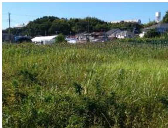
写真3 雑草だらけの農地