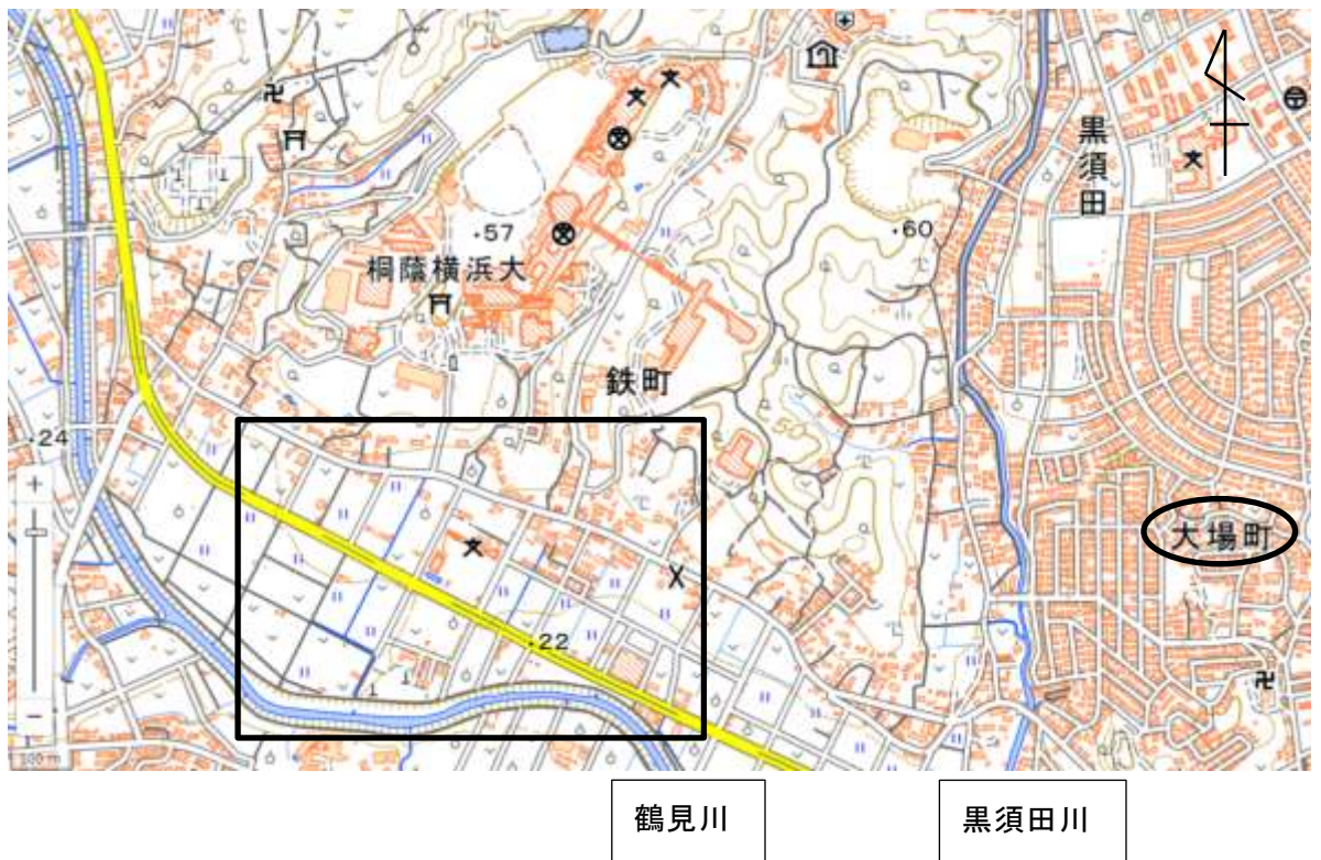
図1 桐蔭学園周辺の地図 〔「地理院地図」に加筆して作成〕