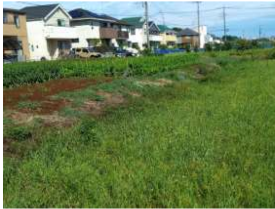
写真2 雑草だらけの農地の向こうに新しい住宅が並ぶ