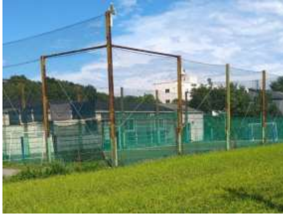
写真1 農地のなかにつくられたフットサル（少人数サッカー）コート