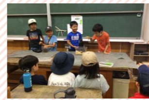
子どもたち自身がプログラムの講師となることもあります。