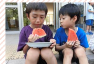
暑い夏には、すいかわりや流しおやつも!