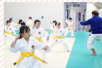
【少林寺】本格的な道場で稽古を行います。中高のお兄さんお姉さんとの交流もあります。