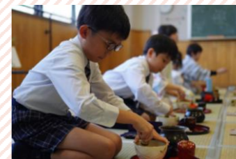
【茶道】一人でお点前できるようにその作法を学びます。日本の素晴らしい文化を五感で感じることができます。