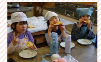
手作りおやつ。自分たちで作るとおいしいね!!!