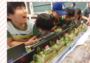
【ジオラマ】小さな材料も使う、細かな作業ですが、その分集中して自分だけの街を作り上げます。完成後は、みんなで電車を走らせて遊びました。