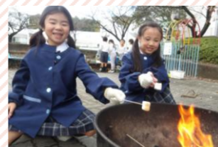
外でたき火をしながら、マシュマロやさつまいもを焼くことも。