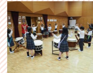
【和太鼓】楽しく和太鼓に触れることをモットーに、みんなで叩いたり、一人ずつ発表したりしました。昨年は、夏祭りで披露も！伝統文化に触れるプログラムなども行っています。