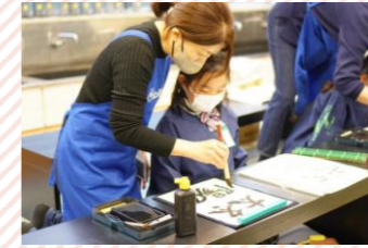
【習字】字をきれいに丁寧に書けるように、心を落ち着かせて取り組みます。