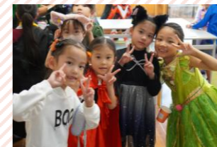
季節のイベントも盛りだくさん!