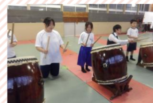
中高のお兄さん、お姉さんとの交流もあります。