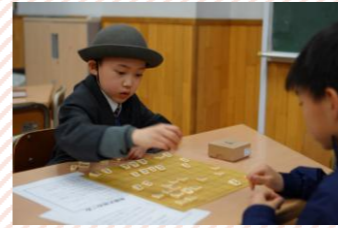
【将棋】対局を中心に楽しみながら取り組みます。年に2回の大会にも挑戦しています。