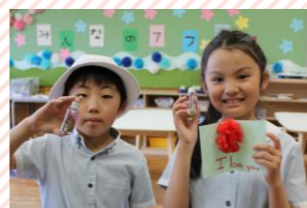
母の日のプレゼントを作りました。

子どもたちはそれぞれ自由に過ごし、遊びます。校庭では思い切り体を動かし、室内では工作やおもちゃで遊ぶことができます。また、小学校との合同プログラムや、子どもたちをよく知るスタッフが企画・開催するプログラムなど、遊びや学びの機会が充実しています。