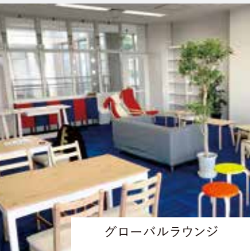
グローバルラウンジ