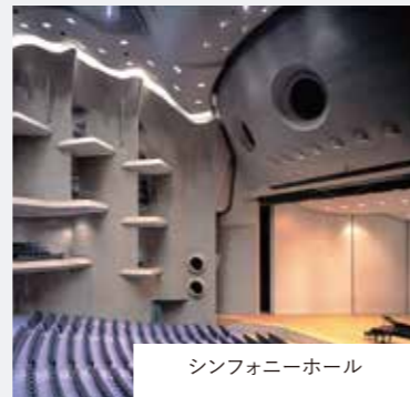
シンフォニーホール