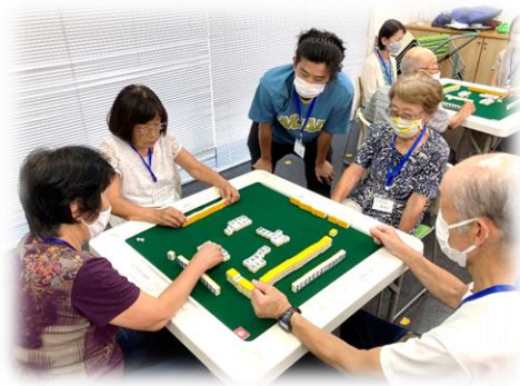
初心者にはマンツーマンで指導

本教室は「健康麻雀の効果検証に関する研究」の一環で実施しています。 そのため、認知機能や脳活動量の測定、アンケート調査にご協力をお願いします。