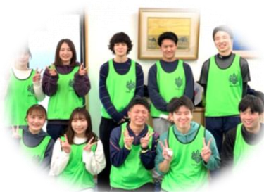
桐蔭横浜大学尾山研究室の学生