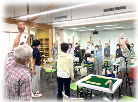
休憩中は体操でリラックス！